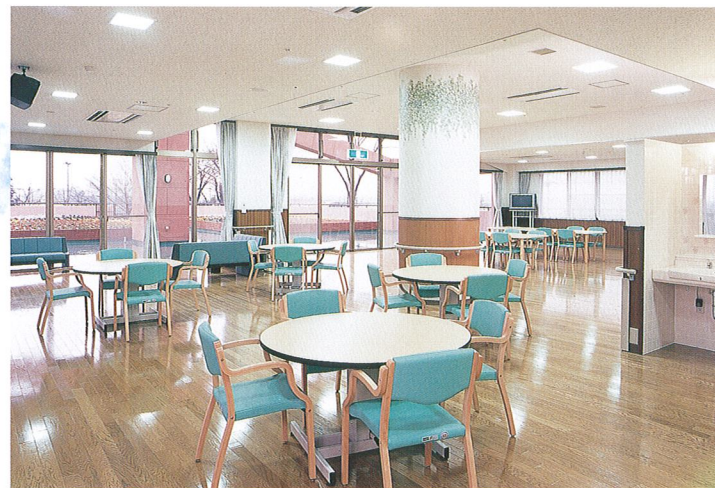
デイサービスセンター