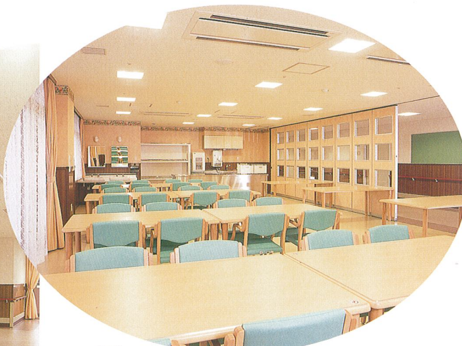
食堂 食事は管理栄養士、調理師によって充実した献立をご用意しております。