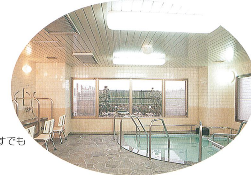
一般浴室 明るい展望風呂、車いすでも入浴ができます。