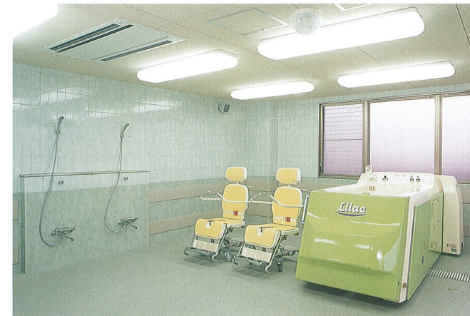
特別浴室 おひとりでお入浴のできない方でも安心して入浴いただけるよう最新設備をご用意しました。

◎介護保険で利用できるサービスについて 介護保険でのサービスは、居宅で介護を受ける方を対象とした「居宅サービス」と施設に入所する方を対象とした「施設サービス」があります。ただし、要介護認定で要介護と認定された方は、いずれも利用できませんが、要支援と認定された方は、施設サービスは利用できません。